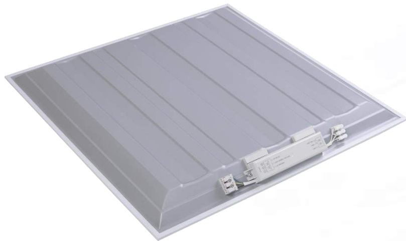
Світлодіодний світильник O66, D66 (600x600 мм)