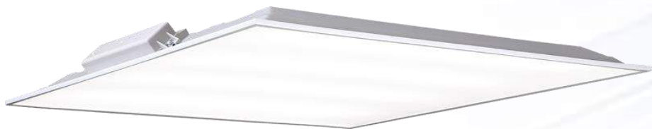
Світлодіодний світильник B66 (600x600 мм)