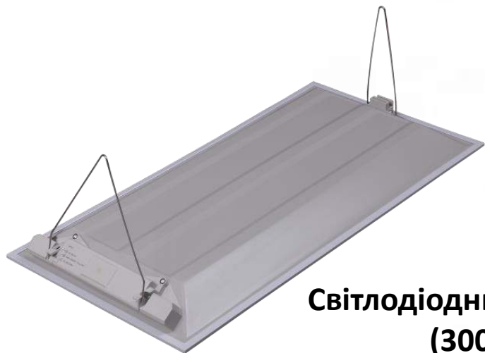
Світлодіодний світильник B36 (300x600 мм)