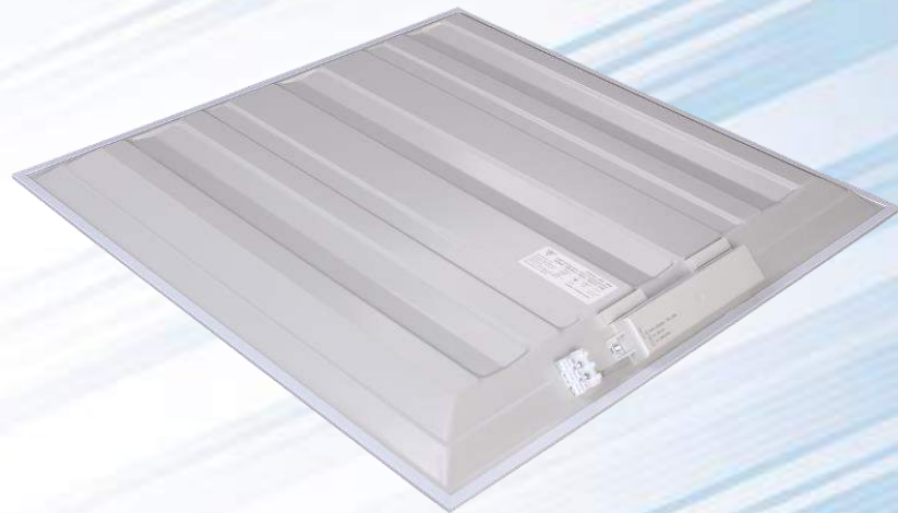
Світлодіодний світильник C66 (600x600 мм)