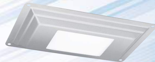
Світлодіодний світильник B12 (для ЖКГ)