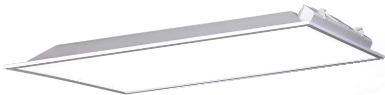
Світлодіодний світильник А36, Е36 (300x600 мм)